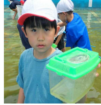
ヤゴやアメンボ がとれました。