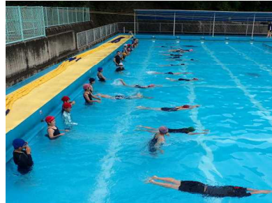
プール開きの日の1年生と5年生です。