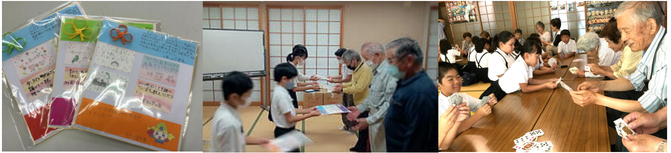
全校生で作ったシトラスリボン付色紙