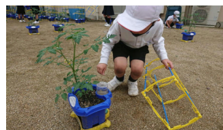
2年 ミニトマトに支えを

1年生はアサガオの種をまき、2年生はミニトマトの苗を植え、5年生はもみまきを行いました。どの学年の子どもたちも、植物の栽培を通して、多くのことを学んでいきます。