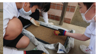
5年 もみまきをしました