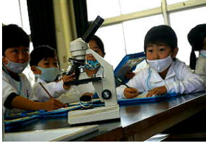
1年 学校探検パート1