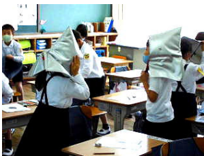
防災頭巾をかぶって

保護者の皆様には、当日のお弁当の用意等にご協力いただきありがとうございました。次回、1～5年生のバスを利用しての秋の校外学習は、9月24日(金)を予定しています。